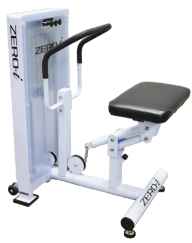
股関節・お尻周辺・太もも周辺の筋肉を整える