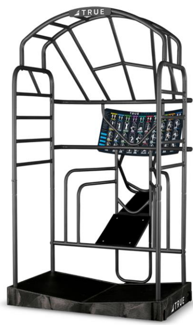
全身の筋肉を整える