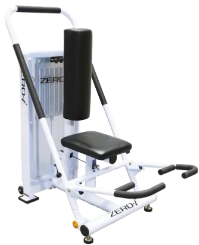
胸・腕・肩・お腹の筋肉を整える