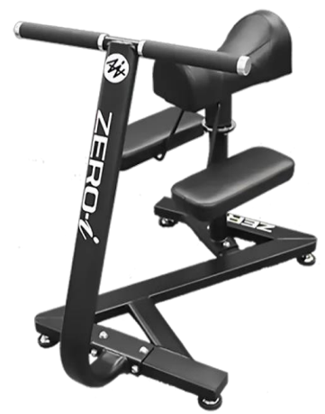
背骨周辺(腰、骨盤、脊柱部)を整える