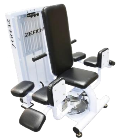
股関節・内ももの筋肉を整える