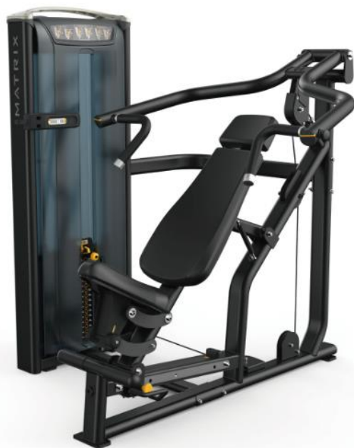
マルチプレス (胸・二の腕・肩)

1台で3種類のトレーニングが可能！ 男性ならたくましい胸を、 女性は綺麗なデコルテを目指そう！