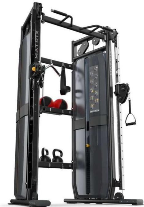
ファンクショナルトレーナー 2台