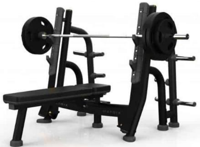
オリンピックフラットベンチ